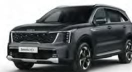
Šedá Interstellar (AGT)