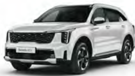
Perleťová Bílá Snow (SWP)