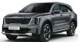
Šedá Steel (KLG)