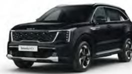
Perleťová Černá Aurora (ABP)