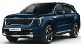
Modrá Gravity (B4U)