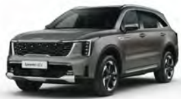
Hnědá Volcanic Sand (BN4)