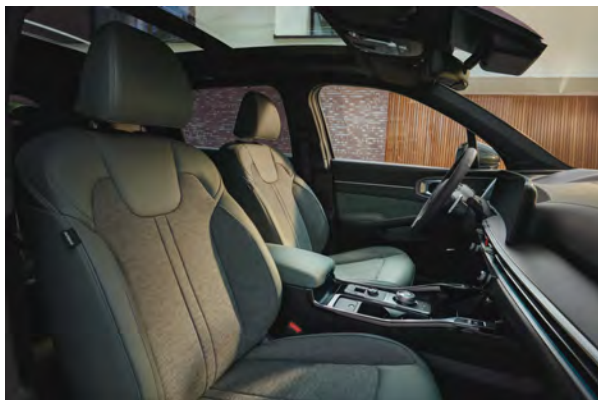
Standardní čalounění - pro Exclusive