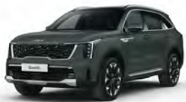
Zelená Cityscape (CGE)