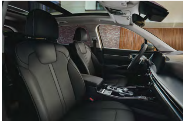
Standardní čalounění - pro Premium, TOP