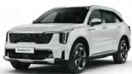
Bílá Clear (UD)