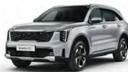
Stříbrná Silky (4SS)