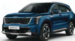
Modrá Mineral (M4B)